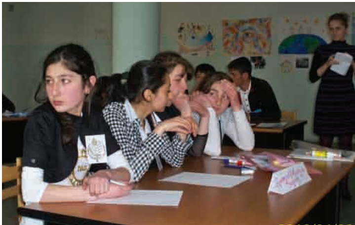
▲ Երեխաները ունկնդրում են հասակակիցների ներկայացումները Եվրոպական ակումբների մրցույթի ժամանակ, 28 ապրիլի, 2010թ.

Գյումրիի դպրոցներից մեկը ապրիլի 28-ին Հիմնադրամի օժանդակությամբ ստեղծված Եվրոպական ակումբների ցանցային ծրագրի շրջանակներում կազմակերպված մրցույթում առաջին տեղի մրցանակ ստացավ Եվրամիության մասին ունեցած տեսական գիտելիքների ասպարեզում: Բոլոր այն դպրոցները, որտեղ եվրոպական ակումբներ են գործում 2007թ. ի վեր մասնակցեցին մրցույթին: Սա առաջին մրցույթն էր դպրոցների միջև՝ ստուգելու նրանց գիտելիքներն ու ստեղծագործ միտքը: Միջոցառումը շատ օգտակար էր ներգրավված դպրոցների համար, քանի որ նրանք կարողացան համեմատել իրենց մյուս դպրոցների սաների հետ և խորհել կյանքի իրական իրավիճակների մասին: