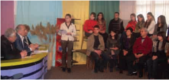
▲ Հեռուստատեսային քոք-շոու «Լաստ» հեռուստաընկերության եթերում, 13 մարտի, 2010թ.

FixMyStreet (Բարեկարգիր իմ փողոցը), WhatDoTheyKnow (Ինչ գիտեն նրանք) ծրագրերը նոր տեխնոլոգիաների միջոցով քաղաքացիների ներգրավման օրինակներ են, որոնք օգուտ են բերում թե անհատներին, թե հասարակությանը, և հաջողությամբ իրականացվել են աշխարհի շատ երկրներում: ԲՀԻ տեղեկատվական ծրագիրը՝ mySociety-ի հետ համատեղ մեկնարկել է մի ծրագիր Կենտրոնական և Արևելյան Եվրոպայում, որի նպատակն է օգնել անհատներին ու կազմակերպություններին ինտերնետի գործածման միջոցով բարելավել քաղաքացիությունն ու հաշվետվողականությունը իրենց երկրներում: