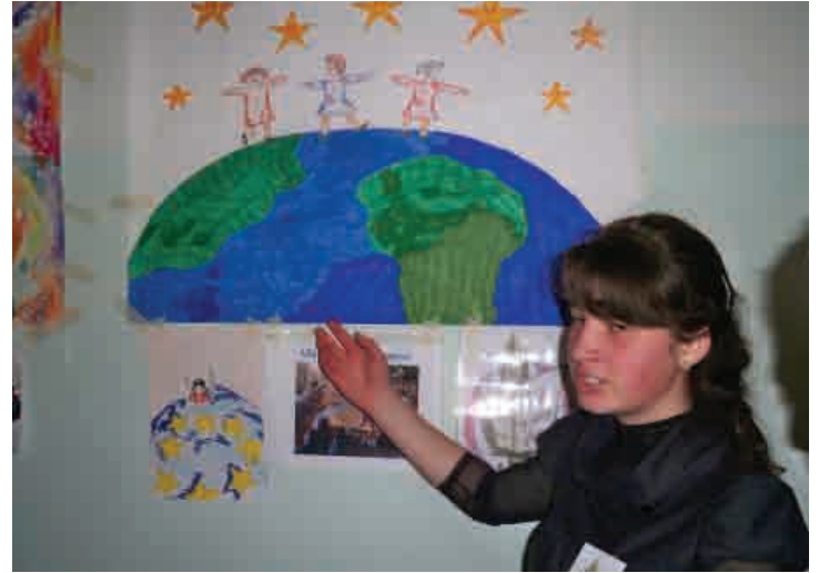
▲ Մրցույթ Եվրոպական ակումբների միջև, 28 ապրիլի, 2010թ.

Հիմնադրամը 2007թ. ի վեր օժանդակել է ութ միջնակարգ դպրոցի՝ ստեղծելու Եվրոպական ակումբներ դպրոցներում: Նախաձեռնության նպատակն է եղել իրագրել պատանի աշակերտներին, ծնողներին և համայնքի անդամներին Եվրոպական գաղափարների և արժեքների շուրջ, կրթել նրանց հանդուրժողականության, հավասարության, մարդու իրավունքների մասին և խթանել քաղաքացիական ակտիվությունը: •