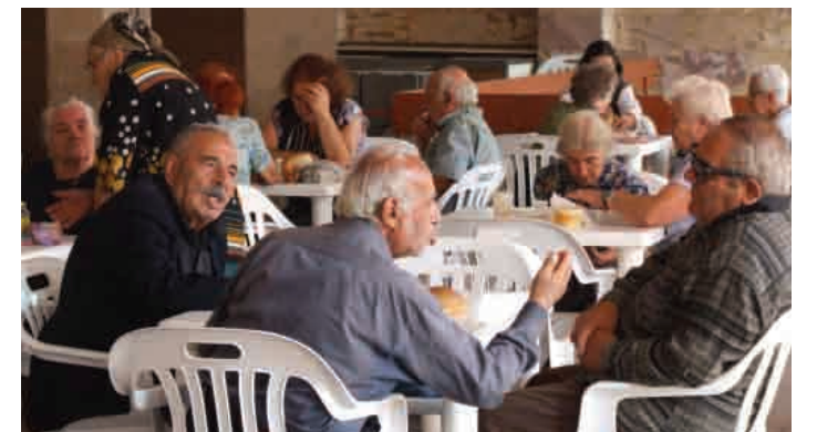
▲ Տաք քննարկմամբ համեմված տաք ճաշ Շենգավիթի ճաշարանում

Առաքելություն Հայաստան ՀԿ-ն, որը հանդիսանում է Հայաստանում սոցիալական ծառայություններ մատուցող հիմնական կազմակերպություններից մեկը, ստացել է 199,000 ԱՄՆ դոլար որպես համաֆինանսավորում երկրով մեկ իրականացվող ծրագրի համար, որը հնարավորություն կտա շաբաթական հինգ օր տաք ճաշով ապահովել