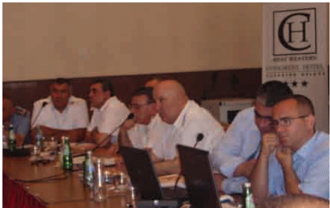
▶ Մոնիթորինգի արդյունքները ներկայացվում են Ոստիկանությանը, 23 հունիսի, 2010թ.

Ս.թ. հունիսի 23-ին Ոստիկանության ձեռքակալված անձանց պահման վայրերում (ԶՊՎ) վերահսկողություն իրականացնող հասարակական դիտորդական խումբը Կոնգրես հյուրանոցում ներկայացրեց 2009թ. տարեկան հաշվետվությունը: Միջոցառմանը մասնակցում էին ազգային և միջազգային կազմակերպությունների, ոստիկանության և ԶԼՄ-ների ներկայացուցիչներ: Քննարկման ընթացքում բարձրացվեցին և քննության առնվեցին մի շարք կարևոր հարցեր, մասնավորապես ԶՊՎ-ների պայմանների (առողջական վիճակի գնումներ, դեղամիջոցների առկայություն ԶՊՎ-ներում), տեղեկատվության հասանելիության, ոստիկանության գործողությունների ու անպատժելիության վերաբերյալ: Քննարկմանը ակտիվորեն մասնակցեցին ու հնչեցրած հարցերին պատասխանեցին ՀՀ ոստիկանության բարձրաստիճան պաշտոնյաները: ▶ տես էջ 2