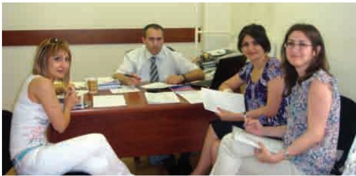
▲ Պալիատիվ բուժօգնության հարցերով աշխատանքային խմբի հանդիպում Առողջապահության նախարարությունում

Պալիատիվ բուժօգնությունը խորացող հիվանդություններով պացիենտների ամբողջական խնամքն է: Ցավի և այլ ախտանշանների կառավարումը, հոգեբանական, սոցիալական ու հոգևոր աջակցությունը հույժ կարևոր են կյանքին վտանգ սպառնացող հիվանդություններով տառապող անձանց ու նրանց ընտանիքի անդամների կյանքի որակը բարելավելու համար: •