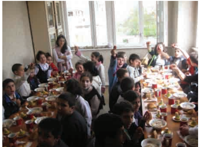
▲ Ձանգակատունը տաք ճաշ է մատուցում երեխաներին, 2010թ.

Հիմնադրամը ֆինանսավորել է «Ձանգակատուն » ծրագիրը 2009թ. դեկտեմբերից և հատկացրել է 90,478 ԱՄՆ դոլար ծրագրի իրականացման համար: Թուֆենկյան հիմնադրամի ներդրումը կազմում է 98,650 ԱՄՆ դոլար: •