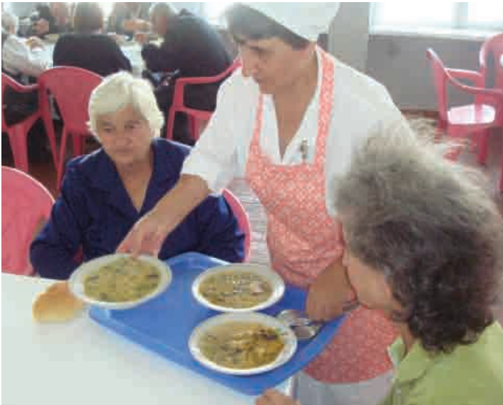
▲ Տաք ճաշի մատուցում Վանաձորի ճաշարանում, Լոռու մարզ, 2010

Մրանից բացի, դրամաշնորհը հնարավորություն կընձեռի շարունակել 21 ճաշարանների գործունեությունը, որոնք փակման վտանգի տակ էին: Ծաշարանները հոյակապ հնարավորություն են հանդիսանում տարեցների համար շփվելու տեսանկյունից, ներառյալ ստեպ-ստեպ ծննդյան տոների նշումը ընկերների շրջանում: •