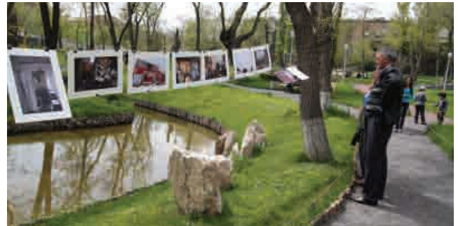
▲ Լուսանկարների ցուցահանդես Սիրահարների այգում, 14 ապրիլի, 2010թ.

Ապրիլի 14-ին «Երրորդ բնություն» ՀԿ-ն Երևանի Սիրահարների այգում ներկայացրեց Անուշ Բաբաջանյանի լուսանկարների ցուցահանդեսը՝ «Յուրաքանչյուր ոք ունի բնակարանի իրավունք» խորագրի ներքո: Հիմնադրամն օժանդակել է թե լուսանկարչին, թե ցուցահանդեսի կազմակերպմանը: Ցուցահանդեսում ներկայացվում էին այն պայմանները, որոնցում ապրում են Գյումրու խարխլված տնակների բնակիչները՝ երկրաշարժից 22 տարի անց: