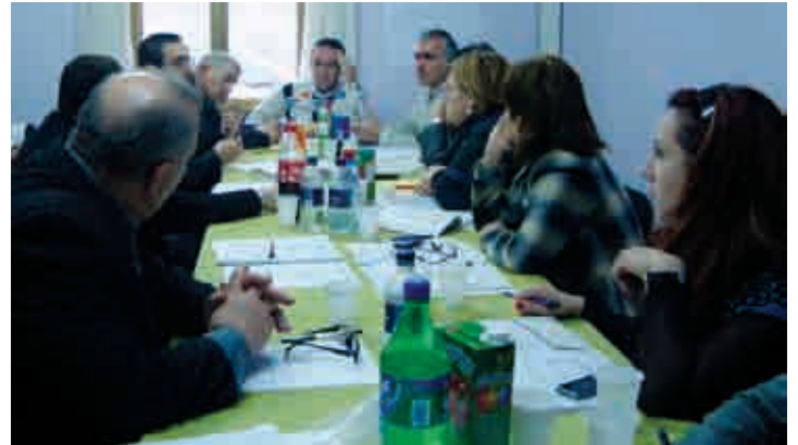
Վերապատրաստում ՀԲԱՎ-ի կողմից առողջապահության և մարդու իրավունքների ոլորտների մասնագետների համար, Վանաձոր, մարտի 10, 2010թ.

են Պացիենտների իրավունքների մասին եվրոպական խարտիայում: Որպես հետագա քայլ նախատեսվում է իրականացնել պացիենտների մարդու իրավունքների իրավիճակի մոնիտորինգ՝ դասընթացներին մասնակցած մասնագետների ներգրավմամբ: Մոնիտորինգի արդյունքում մշակված առաջարկները կներկայացվեն Առողջապահության նախարարությանը: