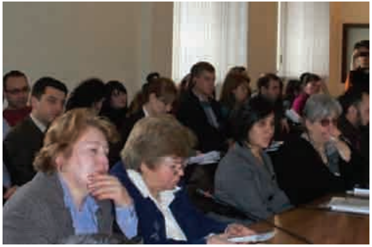
ՀԿ-ները ներկայացնում են Հիմնադրամի և Նիդեռլանդների կառավարության կողմից ֆինանսավորված եռամյա ծրագրի նվաճումները փետրվարի 19, 2010թ.

Հայաստանում ԵՀՔ իրականացման վաղ փուլերից սկսած Գործընկերությունը խթանել և օժանդակել է այդ գործընթացին: Մա արդեն երրորդ գեկույցն է, որ ԵՀՔ գործողությունների ծրագրի ընթացքի վերաբերյալ ներկայացվում էր Գործընկերության անդամների ու փորձագետների կողմից՝ Հիմնադրամի աջակցությամբ: ■