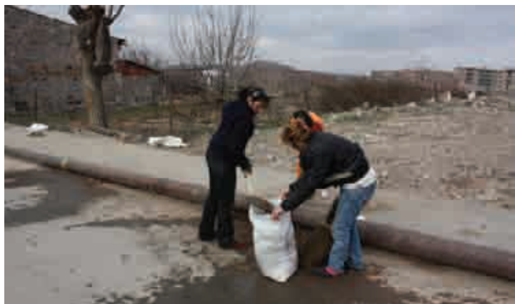
Համայնքի օր Լեռնագոգ գյուղում, մարտի 3, 2010թ.

Հակաճգնաժամային հիմնադրամը տրամադրել է 24500 ԱՄՆ դոլարի օգնություն Արմավիրի և Արագածոտնի մարզի սոցիալապես անապահով գյուղաբնակներին՝ հիմնական սննդի և բժշկական կարիքների համար (մանրամասների համար տես «Գործունեության լրաքաղ»-ի առաջին թողարկումը՝ http://www.osi.am/newsletters/Nov2009-Jan2010_ENG.pdf ):