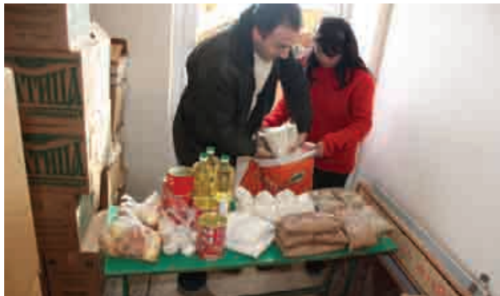
Մյասնիկյան գյուղի շահառուները սննդի ծանրոցներ են ստանում, փետրվար, 2010թ.

Լեռնագոգի գյուղապետը ողջունեց գյուղում ծրագրի իրականացումը՝ պայմանով, որ ծրագրի շահառուները իրենց կողմից ինչ-որ մի լավ բան անեն ի շահ իրենց համայնքի: Գյուղապետը մարտի 3-ը գյուղում հայտարարեց համայնքի օր: Շահառու ընտանիքները հավաքվեցին՝ մաքրելու գյուղի փողոցները: Աշխատանքի մասնակիցների թիվը հետզհետե մեծացավ, երբ իրենց գյուղը աղբից մաքրելու համար ծրագրի շահառու ընտանիքներին միացան համայնքի մյուս բնակիչները:■